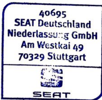
Stempel des offiziellen SEAT-Vertragspartners